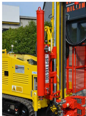
Penetrometro SPT SPT penetrometer Pénétrómetro SPT SPT penetrationsmesser Penetrometro SPT Пенетрометр SPT