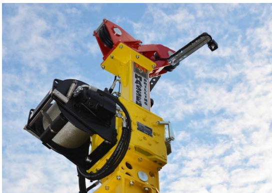
Argano wireline Wireline winch Treuil wireline Cabrestante wireline Wireline Seilwinde Лебедка Wireline