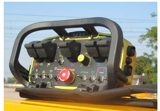
Radiocomando Radio remote control Télécommande Mando a distancia Fernbedienung Пульт радиоуправления